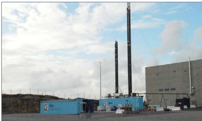
Akers testanlegg får røkgass fra kullkraftverket i bakgrunnen.