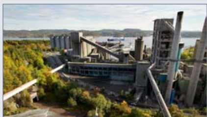
CLIMIT støtter nå også forskning på punktutslipp av CO 2 fra industribedrifter. side 3