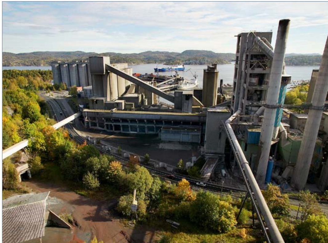
Industribedriftene kan nå også søke om prosjektmidler fra CLIMIT-programmet.

CLIMIT har tidligere fått henvendelser fra industribedrifter om støtte til utvikling av anlegg for CO 2 -håndtering, noe Gassnova og Forskningsrådet måttet si nei til ut fra dagens mandat. I tillegg er en del prosjekter i gråsonen for dagens ordning, for eksempel kraftproduksjon er et biprodukt i integrerte industrielle CO 2 -prosessanlegg.