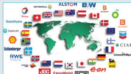
IEA starter en rekke nye CO 2 -studier. side 4